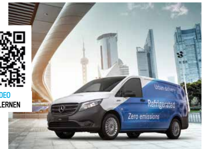
Die e-CoolJet 106-Kühlmaschine ist an der Stelle des Ersatzrades installiert, um die Gesamthöhe und Aerodynamik zu erhalten.