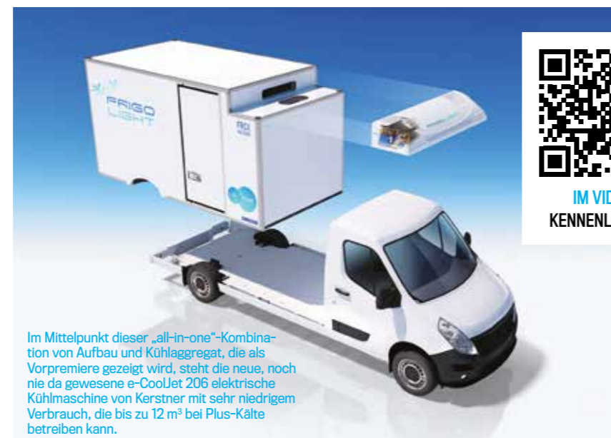
Im Mittelpunkt dieser „all-in-one“-Kombination von Aufbau und Kühlaggregat, die als Vorpremiere gezeigt wird, steht die neue, noch nie da gewesene e-CoolJet 206 elektrische Kühlmaschine von Kerstner mit sehr niedrigem Verbrauch, die bis zu 12 m³ bei Plus-Kälte betreiben kann.

Dieser neue, komplett überarbeitete Kühlaufbau wird auf einer Plattform präsentiert, die dank ihrer ultra-niedrigen Ladekante ideal für die Zugänglichkeit ist. Das Frigolight-Design ist mit allen marktüblichen Fahrgestellen und Plattformen sowie mit allen Antriebssystemen (thermisch, hybrid, elektrisch...) kompatibel. Der Aufbau verwendet eine beispiellose Kombination neuer Materialien, die eine signifikante Gewichtsersparnis ohne Kompromisse in Bezug auf Festigkeit und Isolierung ermöglicht. Die gesamte Karosserie wurde digitalisiert und optimiert, um jegliche Schwachstelle, aber auch jegliches Übergewicht im Vergleich zur