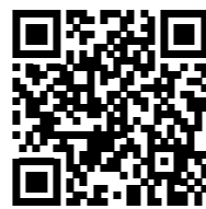
IM VIDEO KENNENLERNEN

fördern. Ihre aerodynamische Form wird berechnet, um den Vorteil eines Leitkörpers im Gestell, der nutzlos geworden ist, auszugleichen, um Kosten und Gewicht zu sparen. Frigolight bietet ein Mass an Robustheit, Haltbarkeit und Isolierung, das dem aktuellen Frigoline-Sortiment von Lamberet entspricht. Sein innovatives Design ermöglicht es, 25% Masse und 20% Scx einzusparen. ■