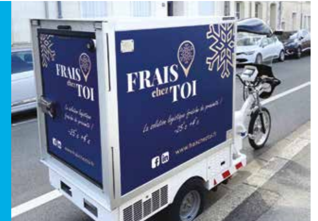
KLEUSTER Freegone ist mit der neuen K 0.31 Frigoline-Koeffizientenzelle und einer Plug & Play Plus-Kühlmaschine ausgestattet.

Der neue Freegone Frigoline von KLEUSTER mit 1.5 m 3 Kühlvolumen ist ein elektrisch unterstütztes Lastenfahrzeug. Null Emissionen, Null Lärm und Null Stau – auch, weil er auf Radwegen fahren kann. Seine Kühlmaschine und seine Karosserie sind ATP-zugelassen. Die neue Frigoline-Zelle bietet eine innovative breite „OT1“ Hecköffnung. Dank seines elektrischer Antrieb fährt es mühelos bis zu 18 km/h an, ist mit einer Berganfahrhilfe sowie einer Tempomat-Funktion ausgestattet und lässt sich innerhalb von 5 Stunden an einer einfachen 230V 16-Ampere-Buchse aufladen. DAS ideale Elektro-Dreirad für Lieferungen in der Stadt!