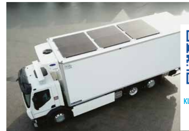
Lamberet hat das Dach der Aufbauten mit 6 Solarmodulen ausgestattet, was einer Fläche von 10 m 2 bei einer Spitzenleistung von 2400 W entspricht.

VIDEO KUNDENEMPFEHLUNG TRANSPORTS PERRENOT